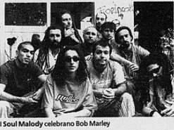
Soul Malody celebrano Bob Marley

nea popolare e delle nuove tendenze in questo ambito. La rassegna si svolgerà principalmente alla Basilica di Superga, quest'anno sede del Soundtown Estivo, che verrà inaugurato il 3 giugno con la performance dei Los Tres. Il cortile interno della Basilica, infatti, oltre ad ospitare gli appuntamenti di Musicantato, sarà aperto tutti i giorni al pubblico, offrendo un ricco calendario di eventi musicali, teatrali e cinematografici. Musicantato sarà inoltre di scena al Parco della Tesoriera e ai Giardini Reali di Torino, e nei comuni di Avigliana, Carmagnola, Corio, Nichelino,