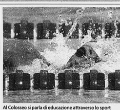
Al Colosseo si parla di educazione attraverso lo sport

Filosofia Per il ciclo «Filosofia in biblioteca. Percorsi filosofici. Guida alla lettura del «Commento» di San Tommaso alla «Politica» di Aristotele», intervento sul tema: «Che cosa fonda la comunità politica, se non l'impegno e l'ingegno degli esseri che la compongono?». Info. 011/313.31.62. Sala Conferenze, via Arnaldo da Brescia 22, ore 18,15